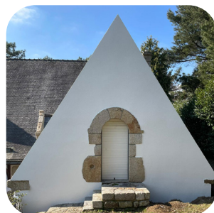
Maison néo-bretonne à Moustoir-Ac