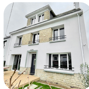
Maison à Vannes