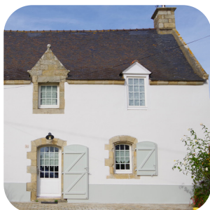
Maison ancienne à Sarzeau