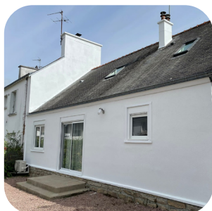
Maison style phénix à Vannes